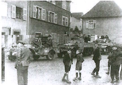
2 février 1945 – 1 er février 2025

1945-2025 80 ème anniversaire de la Libération